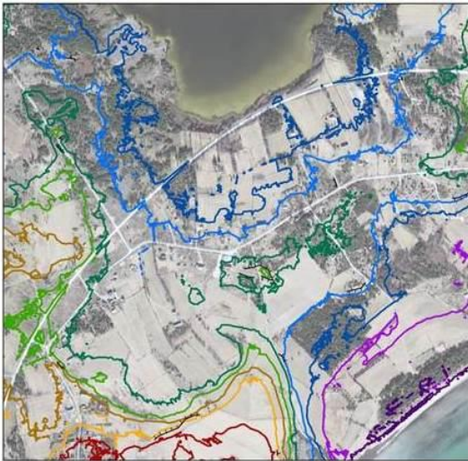
Figur 1. Landhöjningskarta med klintar och kustlinjer för vart 500:e år upp till 4500 år tillbaka skapad utifrån GSD-Höjddata, grid 2+ © Lantmäteriet. Bakgrundsbild: Ortofoto, 1m färg © Lantmäteriet (2014).

Du har använt höjddata från Lantmäteriet för att skapa ny data, i detta fall äldre kustlinjer, och visar detta med ett ortofoto från Lantmäteriet som bakgrund.