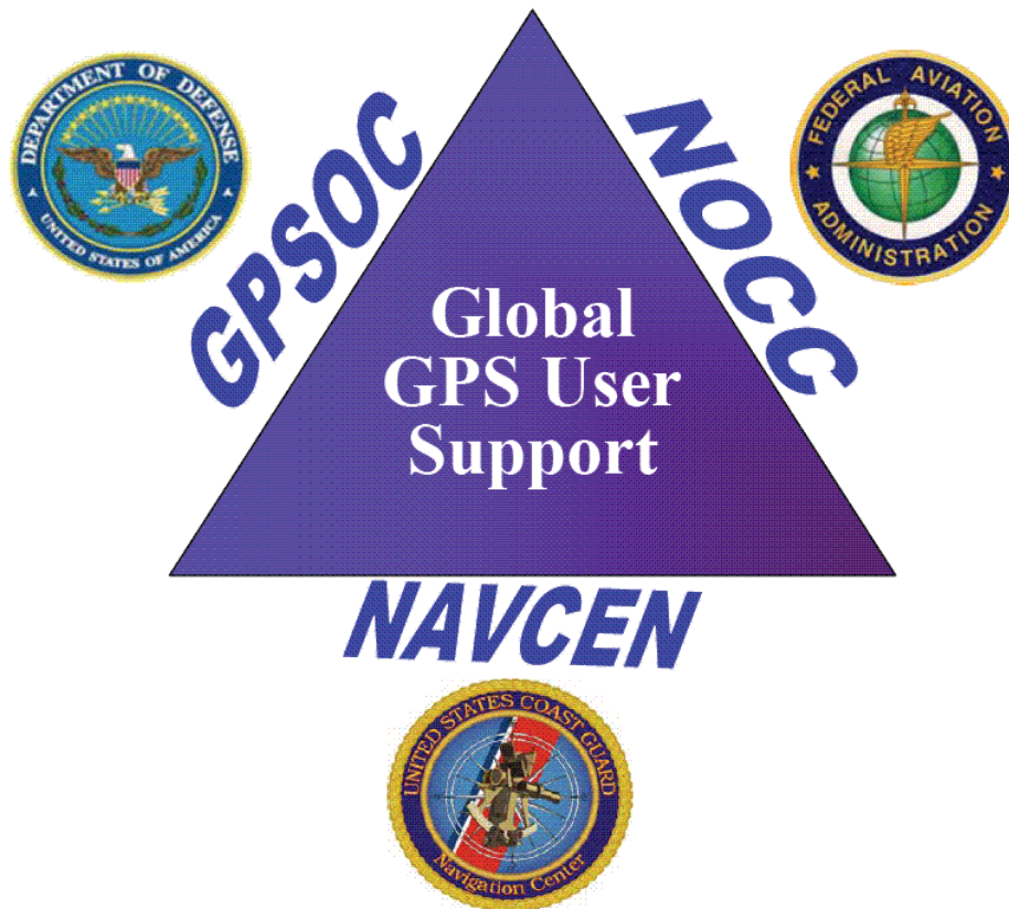
Figur 3: Användarsupporten för GPS är uppdelad i tre olika organisationer.