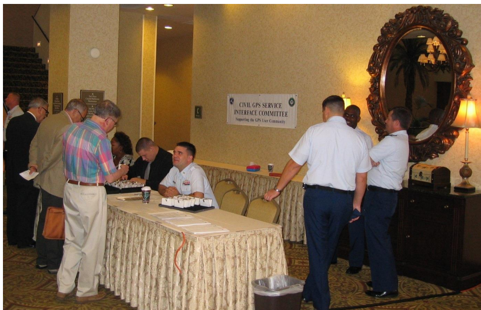
Figur 1: Registreringen vid 2007 års CGSIC-möte i Fort Worth, Texas.

Det civila inflytandet i det i grunden militära amerikanska satellit-baserade navigations- och positionsbestämningssystemet GPS (Global Positioning System) sker främst via USA:s transportdepartement. För dess informationsutbyte med civila GPS-användare har CGSIC (Civil GPS Service Interface Committee) bildats och varje år hålls ett internationellt möte. Det 47:e CGSIC-mötet arrangerades i Fort Worth, Texas, USA, 24-25 september 2007 och hade samlat ca 120 deltagare. Lantmäteriet är svensk kontaktorganisation för CGSIC och var på mötet representerat av undertecknad.