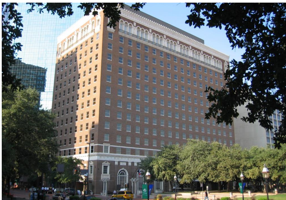
Figur 2: Det 47:e CGSIC-mötet arrangerades på Hilton Hotel i Fort Worth, Texas, USA, 24-25 september 2007.

Det 47:e CGSIC-mötet arrangerades på Hilton Hotel i Fort Worth, Texas, USA, 24-25 september 2007. Mötet hade samlat ca 120 deltagare, varav de flesta kom från olika departement, myndigheter och organisationer i USA.