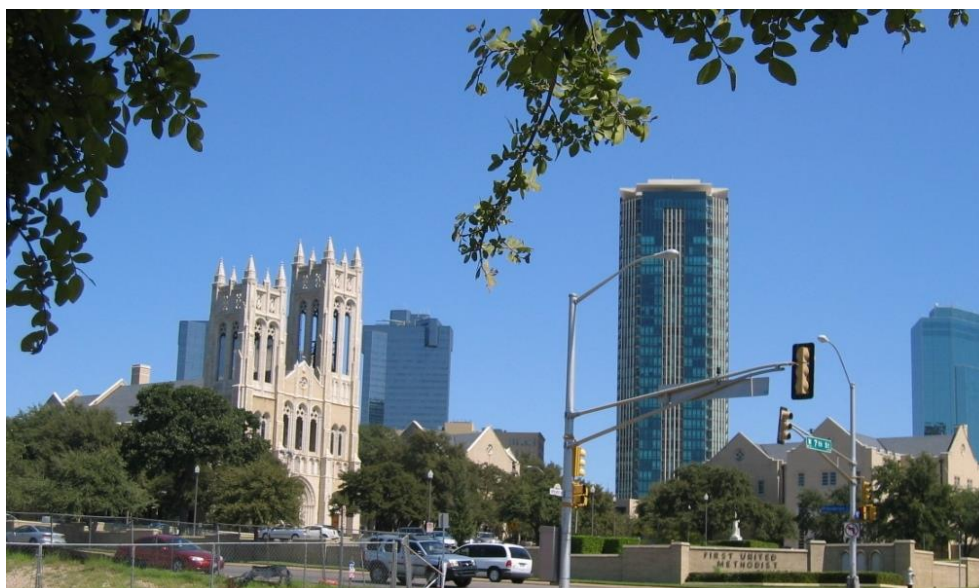
Figur 6: Klart och soligt väder rådde i Fort Worth under CGSIC-mötets båda dagar.