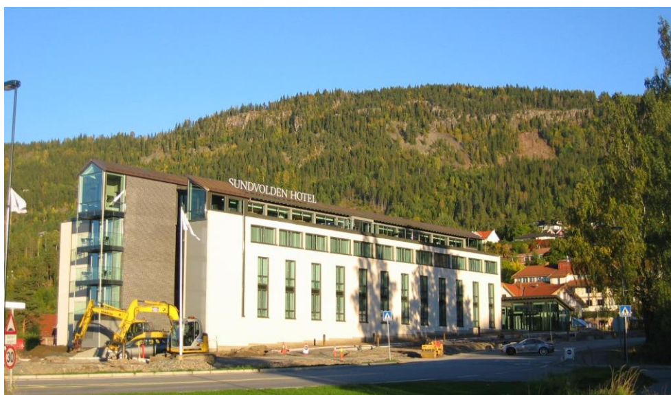
Figur 2: Det 16:e NKG-mötet arrangerades på Sundvolden Hotel i Sundvollen, Norge, 27-30 september 2010.

Det 16:e NKG-mötet arrangerades i Norge måndag-torsdag 27-30 september 2010. Statens Kartverk, som har sitt huvudkontor i Hønefoss väster om Oslo, höll i arrangemanget. Som mötesort hade Statens kartverk valt Sundvollen beläget strax söder om Hønefoss och det där belägna Sundvolden Hotel, se figur 2.