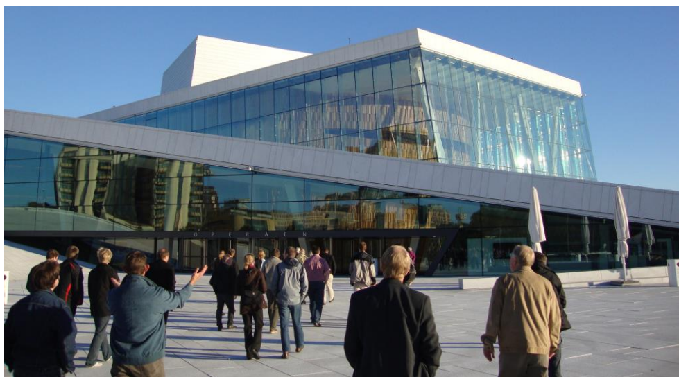
Figur 8: Operahuset i Oslo är beläget i direkt anslutning till Oslofjorden. Statens Kartverk har via bl.a. landhöjningsberäkningar bidragit till att byggnaden har byggts så att risken för översvämningar vid högvatten och p.g.a. eventuella framtida havsnivåhöjningar skall vara försumbar.

En bussresa till Oslo ordnades också. Under denna genomfördes studiebesök på Vikingskipshuset, ett museum med bl.a. tre stora skepp från vikingatiden, samt på operahuset i Oslo, se figur 8.