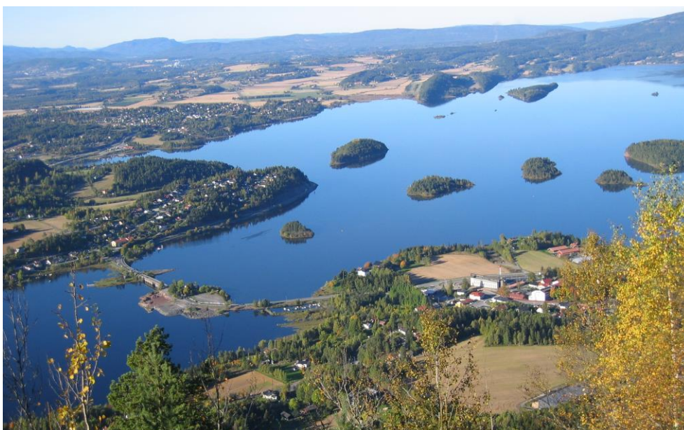
Figur 3: Klart och soligt höstväder rådde under det 16:e NKG-mötet 2010 i Sundvollen, Norge.