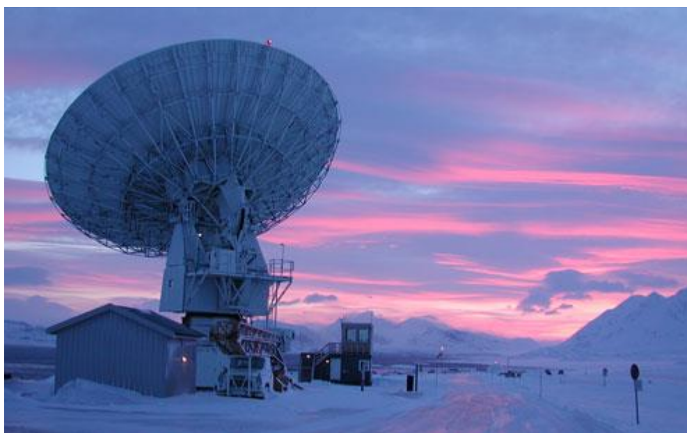
Figur 4: Statens Kartverks geodetiska observatorium i Ny-Ålesund på Svalbard med radioteleskopet för VLBI i förgrunden (foto: Statens Kartverk).