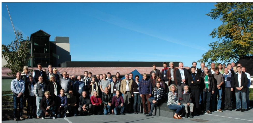
Figur 1: Det 16:e NKG-mötet 2010 hölls i Sundvollen, Norge, och hade samlat 73 deltagare.

Mötet hade samlat 73 deltagare och 11 av de 15 deltagande svenskarna kom från Lantmäteriet, se figur 1.