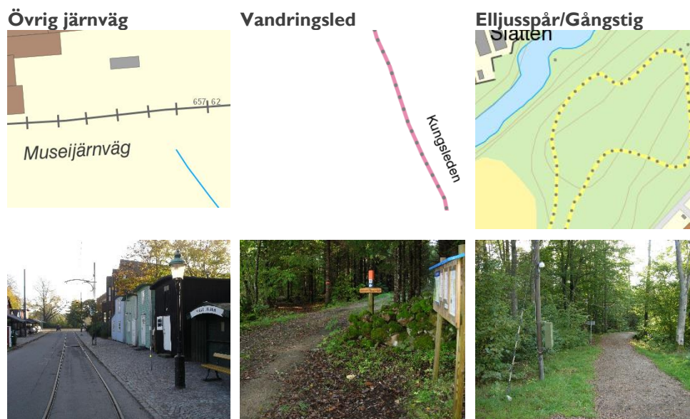
Tabell 10- Exempel på övrig kommunikation.

Anm: Cykelvägar levereras till Trafikverkets nationella vägdatabas (NVDB).