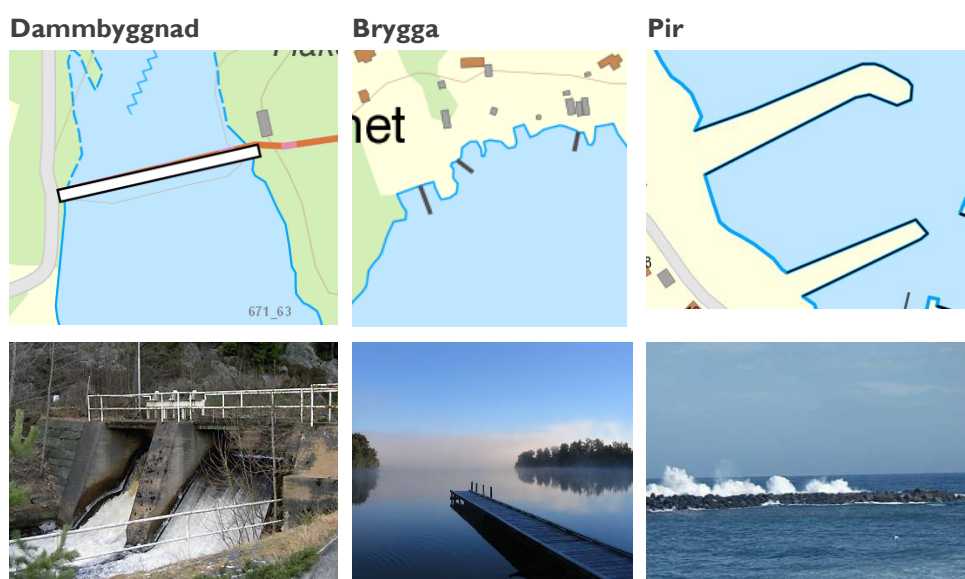
Tabell 8- Exempel på hydrografianläggningar