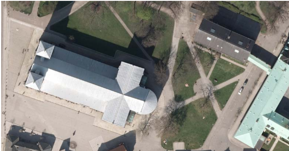
Bild 2.3.4 Exempel på ortofototyper framtagna med olika rektifieringsmodeller.