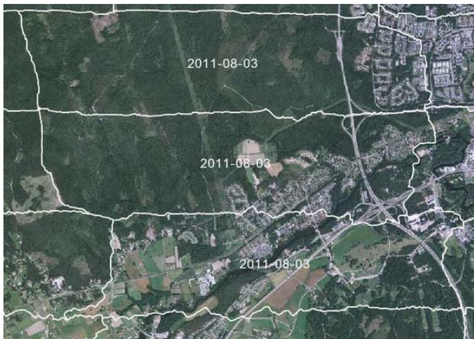
Figur 2.4.3: Ortofoto med redovisad yttäckning för mosaikelement med fotograferingsdatum som attribut.

För HMK-standardnivå 1 gäller att yttäckning för mosaikelement ska redovisas med attributen bildidentitet och fotograferingsdatum.